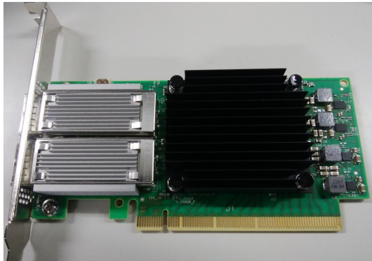
Full Height ブラケット