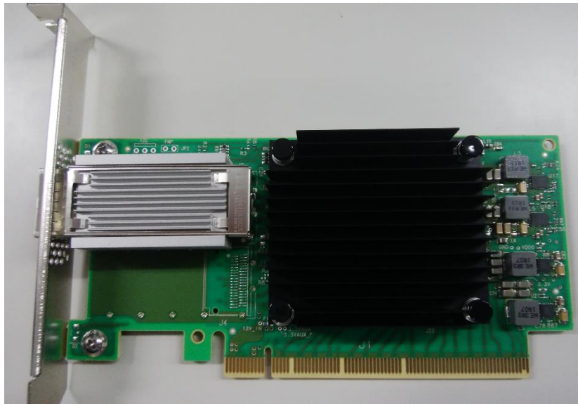
Full Height ブラケット