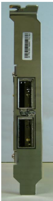
コネクタ面 (Full Heightブラケット)