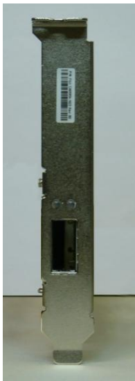
コネクタ面 (Full Height ブラケット)