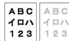
トナーセーブ無効 トナーセーブ有効