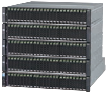
* ETERNUS DX200 S4

全モデルとも、コンパクトな基本筐体（薄さ2U・約8.8cm）から柔軟にスケールアップできます。2.5インチ/3.5インチの各種ドライブを採用し、同一インチのドライブは混在搭載できます。増設は1台単位に、無停止でボリューム拡張が行えます。