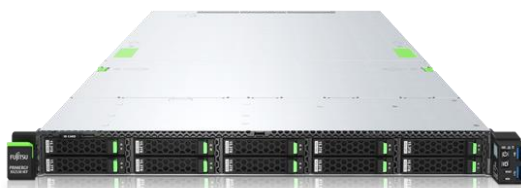
PRIMERGY RX2530 M7

第4世代インテル® Xeon® スケーラブル・プロセッサを採用したFujitsu Server PRIMERGYと、分子動力学オープンソースソフトウェアLAMMPSにより、分子動力学計算の業務スピード向上・生産性向上を実現します。