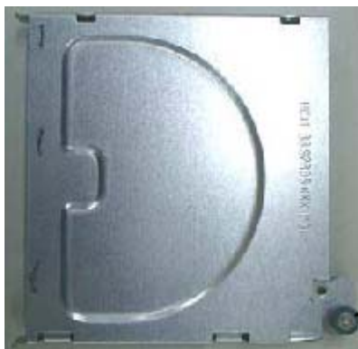
RX100 S2用専用ベイ搭載フレーム