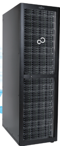
ラック搭載時 イメージ図