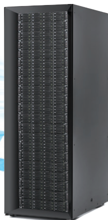
ラック搭載時 イメージ図