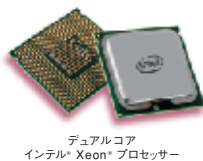
デュアルコア インテル® Xeon® プロセッサ

「インテル® Pentium® D プロセッサ」に加え、CPUに、パフォーマンスと電力効率に優れた最新の「デュアルコア インテル® Xeon® プロセッサ 3000番台」を採用。Webサーバなど複数台サーバの導入に最適で、TCOの削減が期待できます。