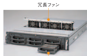
冗長ファン ハードディスク