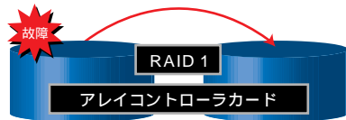
ハードディスク × 2

ハードディスクを二重化し、低価格で信頼性を向上するIDE-RAID1アレイタイプを提供。また、SCSIタイプでは、低価格のSCSIアレイコントローラカードにより、RAID 0,1,5のアレイ構成が可能です。