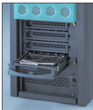
ホットプラグ対応 ハードディスク

SCSIタイプは、オプションのSCSIカードにより、最大160MB/sの転送速度を持つ「Ultra160 SCSI」をサポート。高速データ転送を実現します。低価格エントリーサーバながら標準でハードディスクのホットプラグに対応。内蔵HDDを最大4台まで搭載し、コンパクトな筐体に内蔵で最大293.6GBまで増設できます。