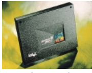
Pentium® III Xeon™ プロセッサ

最新CPU Pentium®III Xeon™ プロセッサ900MHz / 700MHzを搭載 CPUには、二次キャッシュメモリを2MB / 1MB内蔵した最新のPentium®III Xeon™ 900MHz / 700MHzを搭載。4CPUまでのSMPに対応し、ハイパフォーマンスなシステムをご提供します。