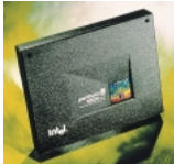
Pentium® III Xeon™プロセッサ

CPUには、0.18ミクロン・プロセス技術を採用し、CPUと同じ周波数で動作する二次キャッシュを256KB内蔵した最新のPentium®III Xeon™プロセッサ1GHz / 933MHzを搭載。2CPUまでのSMPに対応し、ハイパフォーマンスなシステムをご提供します。