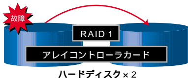
RAID1 アレイタイプの構成

「アレイコントローラカード」を搭載したRAID1アレイタイプを提供。ハードディスクを二重化し、低価格で信頼性を向上するRAID1アレイタイプを提供しました。