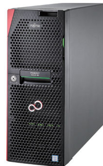
1WAYタワーサーバ TX1330 M4