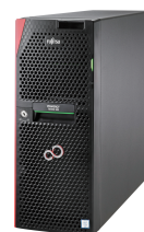
1WAYタワーサーバ TX1330 M3