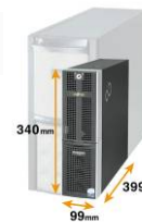
コンパクトサーバ専用PCワゴン(オプション)

1WAYタワー型サーバ「PRIMERGY TX150 S7」と比較し、設置面積を3分の1に、容積を4分の1にまで削減し、大幅な省スペース化を実現しました。また、縦置きだけでなく横置きも可能です。コンパクトサーバ専用PCワゴンや連結フット(共にオプション*3)により、サーバはもちろん同サイズの無停電電源装置(UPS)もセットにして設置できます。