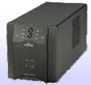
無停電電源装置 「Smart-UPS 750J」