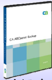
バックアップソフト 「CA ARCserve Backup r12 for Windows」