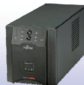
無停電電源装置 「Smart-UPS 750J」