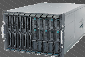
BX620 S3/BX620 S2 (BLADE)