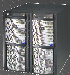
TX150FT S4 (FT Virtual Server)