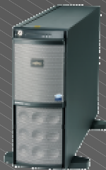
TX200 S3 /TX200 S2