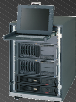
TX200FT S2 (FT Virtual Server)

例えば、 1WAYモデルでの信頼性への こだわりをご紹介します。(TX150 S4, RX100 S3)