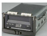
内蔵DAT72 ユニット (ドライブケージ付)

内蔵バックアップ装置(PRIMERGY SX10使用) または 外付バックアップ装置 *4