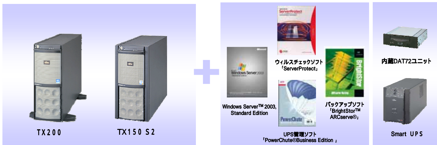
* 写真はTX200の構成のイメージです。TX150 S2は下記の製品構成を参照ください。

PRIMERGYでは、OS、メモリ、ハードディスクのほか、信頼性を高めるバックアップ装置やUPSなどシステム導入に必要な製品をセット化し、お求めやすい価格でご提供します。