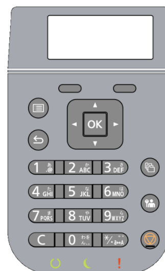
XL-8400 操作パネル (オペレータパネル)

「紙づまり」や「トナーを交換してください」など「印刷できない状態のエラー」発生時はエラーランプが点灯/点滅し、エラーメッセージは表示されます。