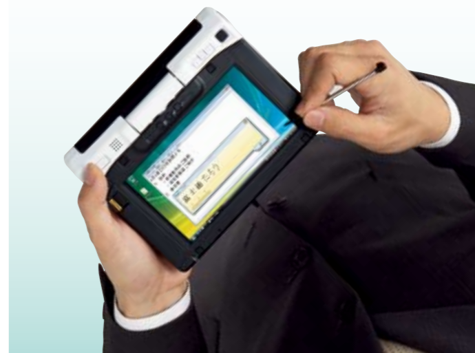
●立ち姿勢でのペン入力利用シーン