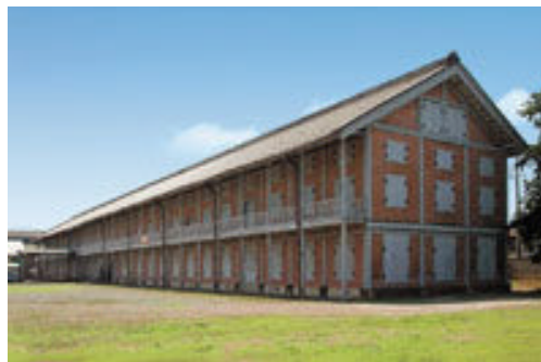
▲西蔵倉庫全景。乾燥のために窓を開け放ち、繭を保管