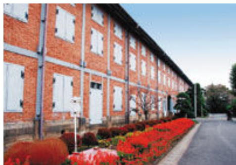
▲当時の威容を偲ばせる東蔵倉庫

創業当初のままの良好な状態で保存されている、繰糸場、東・西蔵倉庫、外国人宿舎（女工館、検査人館）、ブリューナ館の主要建物（国指定重要文化財）などをご覧ください。明治政府がつくった官営工場の中で、このようにほぼ完全な形で残っているのは『富岡製糸場』だけです。