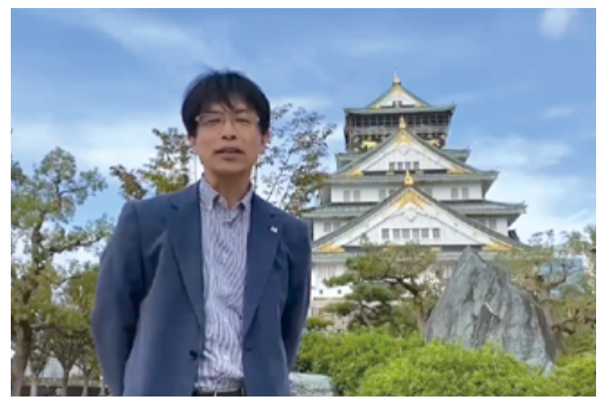
開催地である関西支部からは、関西エリアの見どころやスポットが紹介された。こちらはリアル大阪城公園からのビデオメッセージ

2021年度FUJITSUファミリ会秋季大会は、関西支部(大阪市)と結んで、完全オンライン形式で開催されました。 「サステナブルな社会を生きる企業のDXとは」をテーマに、DX、SDGs、カーボンニュートラルなど、時代のキーワードに焦点を当て、企業が、また私たち1人ひとりが、社会の一員として取り組むべき課題を取り上げ、各界の有識者の提言、会員企業様の取り組みなどをご紹介します。 会員の皆様と直接お会いすることはできませんでしたが、3日間を通して多くの皆様にご視聴いただき、たくさん感想が寄せられています。そうした声を交えて、オンライン秋季大会の模様をご報告します。