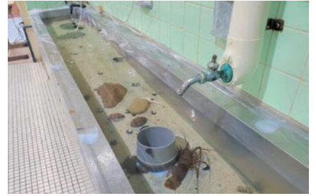
かつての手洗い場は伊勢海老やヒトデに触れられるタッチプールに变身

開館後も、重複しやすいネットの情報発信はTwitterに一本化し、1日1本の配信のみで返信はしないという省力化の運営に加え、イベントのポスターやチラシも作らず、メディアへ広告やリリースを出さないなど、徹底した効率化によるローコスト運営で黒字に導く。