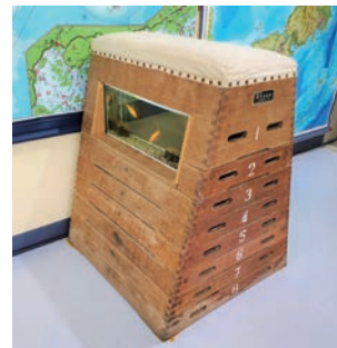
跳び箱をリメイクした水槽

一方、「楽しい場所へ人は集まる」を信条にスタッフ自ら楽しみながら、水族館や小学校を意識したイベントを次々に開催。お盆にはラジオ体操を行って早朝から営業し、来館者に喜んでもらいながら混雑分散にも成功。ほかにも、25mプールに筏風の設備を期間限定で設けたり、今後、大晦日には流し台で蕎麦を流す流し年越し蕎麦をふるまったり、縄跳びで作ったしめ縄を装飾したりするイベントを予定している。