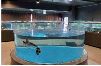
室内にある円形水槽では至近距離でウミガメの観察ができる

校舎2階の水槽エリアから3階に上がると、懐かしの教室や理科室、図書室などがまるで映画のロケ地のように残されている。大きな定規やそろばんといった教材が置かれ、壁には子どもたちがいかすみで書いたという習字がズラリ。耳を澄ませば、来館者が奏でる木琴や鉄琴の音も響いている。「公立小学校は規格がほぼ同じなので、誰もが懐かしい気分になるようです。記念写真を撮る来