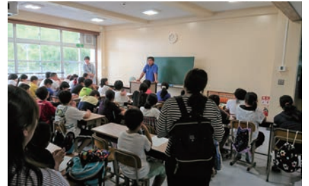
教室で開催されるイベントはまるで授業のよう