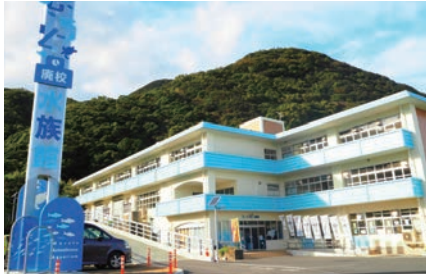
むろと廃校水族館外観