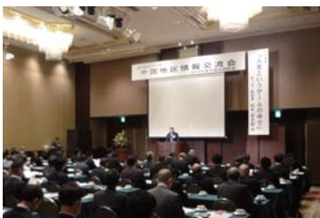
2018年度中国支部総会