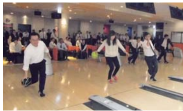
富士通(株)北海道支社70周年記念「親睦ボウリング大会」始球式

2019年度は元号も変わりますので、また新たな気持ちで、北海道支部および会員各企業の発展に向け、尽力してまいります。