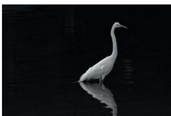
表紙のことば (日本の鳥シリーズ)