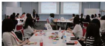
人気のレディースセミナー

である「継続は力なり」で築きつないできた絆を大切に、「ICT知識や技術」と共に「人としての心」のスキルアップも目指し、宝である人材の人間力向上に貢献してまいります。2020年には東北で全国秋季大会が予定されています。阪神・淡路大震災から25年、熊本地震から5年目、そして、東日本大震災においても10年目となる大変意味のある年に「震災を風化させない」というメッセージを発信してまいります。