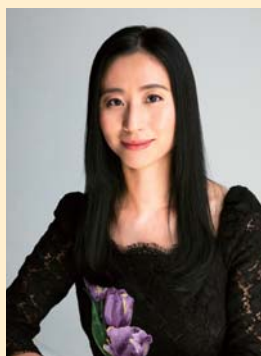
国際政治学者 山猫総合研究所 代表 みうらるり 三浦瑠麗氏