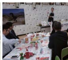
(左) 復興支援 親子 de ファミリー会「ドローン操縦 & プログラミング体験!」 (右) 大分地区交流会「三和酒類(株)様プレゼンツ オリジナルカクテルワークショップ」