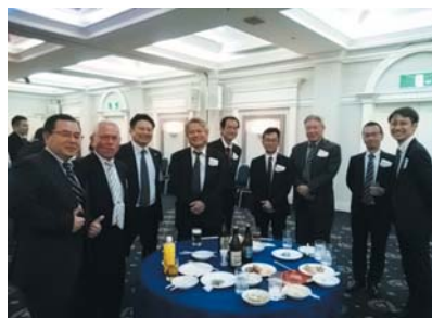
2018年度支部総会記念講演会・懇親会