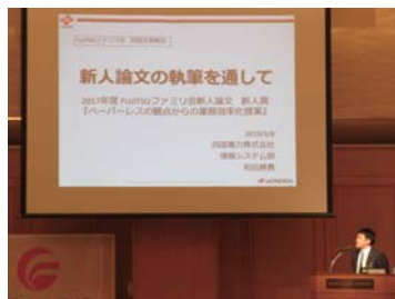
支部総会に新人論文 発表を新たに取り入 れました