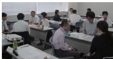
「ビジネススキルアップセミナー」長野・新潟各地区で開催

新潟は東西に、長野は南北に広い地域です。気候も自然風土も異なる各地域の皆様、若手から女性やベテランの方々まで、誰もが参加しやすい活動を推進してまいりたいと思っております。会員の皆様の積極的なご参加をお待ちしております。