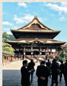
プランE 善光寺と松本城の見学