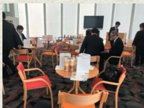
プランA ホクト株式会社の視察