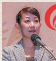
フリーアナウンサー 郷原 利枝氏