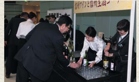
屋台コーナーには信州の名物や地酒も並び