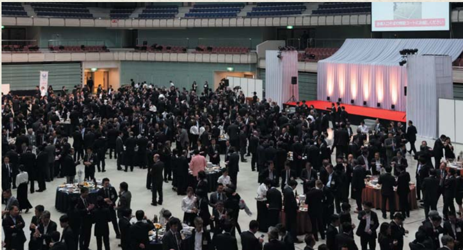
懇親会にも多くの方が参加、交流を楽しんだ