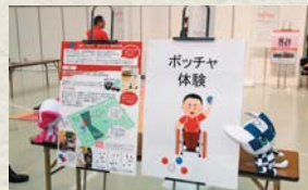
会場に特設され たポッチャの体験 コーナー