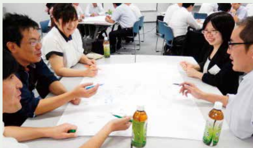
積極的な意見交換に自信もUP!

東北支部では、“日々進化する情報システムへの理解を深め自信をつける”“人間力向上”を目的に、ICT・ヒューマン系、また、プロジェクトマネジメントなど、人財育成に重点をおいたセミナーを開催しています。特に好評をいただいているのが年2回開催のヒューマンスキルアップセミナーです。新入社員～入社3年目の若手向き、中堅～リーダー・幹部社員向きと、各階層ごとにテーマを