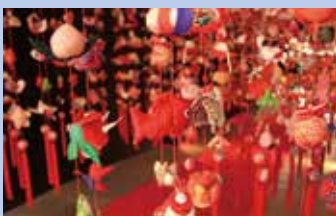
表紙のことは (日本の祭りシリーズ) つるし雛 長野県下伊那郡根羽村

LS研究委員会のホームページをご参照ください。 http://jp.fujitsu.com/family/lksen/