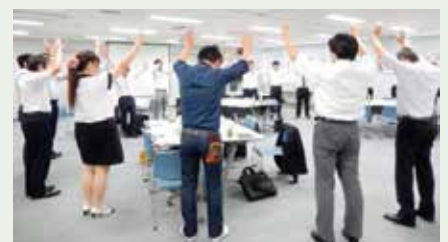
一体感を高める動作で思考も柔軟に!

ご参加をいただいた会員の皆様からは「チームの成果を上げるために考えるべきものが明確になった」「参加するまではグループ討議は不安でしたが、初対面の方々と交流ができ自分に自信がつかました」などの感想を多数いただき、年々、人気度が上がっている行事です。未体験の会員様、是非、一度ご参加をしてみませんか。