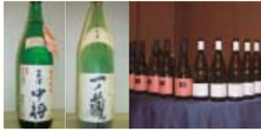
懇親会 日本酒コーナー

中国支部では、一人でも多くの会員が参加していただきやすいように、一昨年より名称を「支部総会」から「情報交流会」と改め、開催しています。 昨年は「東日本大震災」発生の直後ということもあり、中止にさせていただきましたが、今年度は、特別講演ではソムリエの田崎真也氏から「サービスの原点はどこにあるべきか」などを非常に興味深く、貴重な経験を