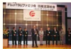
役員全員で中締め

2011年度信越支部活動は、ほぼ例年通りの事業を実施する事ができました。特に新しいメニューを取り入れた研究会には、初参加の方が多く、ファミリー会活動に理解を深めていただく貴重な場となりました。当日は、恒例の分科会成果発表会から始まりました。少々緊張気味のメンバーが、一年間の活動を立派に披露しました。支部総会議事も各位のご協力のもと無事承認され、引き続き記念講演は、林氏の温かいお話に出席者の皆様が吸い込まれるようにして聞き入り、70分間があつと言う間に経過、当日は「心ゆたかに」が合言葉のように飛び交っていました。