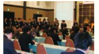
分科会参加メンバー。こんなにもたくさん のメンバーが活動しました