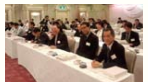
記念講演に聴き入る会員様

また、懇親会では会員同士和やかな雰囲気で行われ、終了後も話が尽きずに歓談されている会員様もいらっしゃいました。