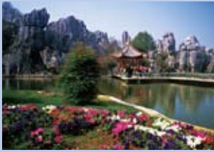
中華人民共和国 雲南省石林 2007年 ユネスコ世界自然遺産登録

雲南省石林は、貴州省荔波(れいは)の森林カルスト、重慶市武隆の立体カルストとともに、「中国南方カルスト」の一つとして2007年世界遺産に登録された。雲南省昆明市の南東に位置する石林カルストは、剣や柱、塔などさまざまな形の奇岩が林立する景勝地で、迫力に満ちた景観は古くから「天下の奇観」と呼ばれている。ここは、2億7000万年前には海底だったが、地殻変動により隆起し、悠久の時間をかけて雨水の浸食や風化の作用によって現在の姿に変化した。