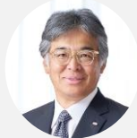
富士通株式会社 CEO 時田 隆仁