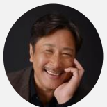
富士通株式会社 COO 大西 俊介