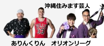
ありんくりん オリオンリーグ