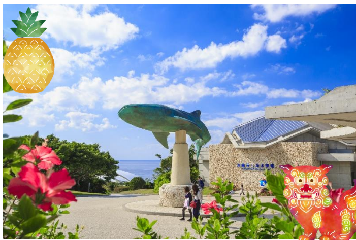
国営沖縄記念公園（海洋博公園）：沖縄美ら海水族館