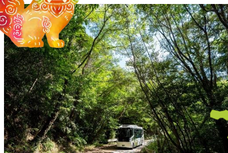
ネイチャーツアー