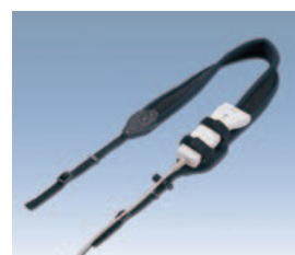
ネックストラップ (スキャナ別売)

※WindowsXP、Windows2000、VisualC++.NET2003、VisualC#.NET2003、VisualBasic.NET2003、MicrosoftVisualStudio.NET2003、eMbeddedVisualC++4.0は、米国MicrosoftCorporationの米国及びその他の国における登録商標です。 ※コンパクトフラッシュは、米国Sun Disk Corporationの商標です。※Bluetoothは、Bluetooth SIGの商標で富士通へライセンスされています。※その他、記載されている会社名、製品名は、各社の登録商標または商標です。 ※表紙および本文中の本体写真と画面は合成したもので、実際とは異なります。