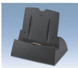
クレードル (USB×2、充電機能付き)