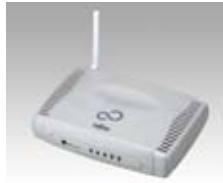
無線基地局 ※無線基地局は別売です。

標準で有線LANをサポート。また、設置場所を限定しない無線LANタイプもご用意しました。無線LANタイプは内蔵アンテナに加えて、必要に応じて接続できる外部アンテナを標準添付しています。