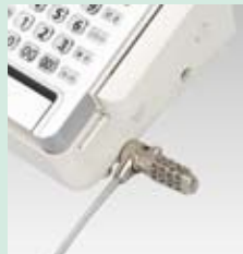
※盗難防止ワイヤーは付属しません。

耐タンパー機能搭載により、内部解析や不正改造を防止します。また、セキュリティスロットに盗難防止ワイヤーの取付けが可能です。