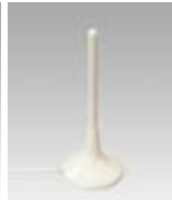
外部アンテナ (無線LANタイプに添付)