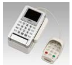
暗証キーパッド(オプション)装着例

外部インターフェースとしてRS-232C×2・USB×2を搭載。暗証キーパッドや電子決済端末などの接続に対応します。また、大容量メモリ搭載で、アプリケーションの拡張にも対応します。