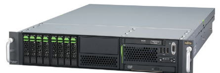
※写真はラック用T-handle適用時。

3年間のハードウェアの標準保証 (翌営業日以降訪問修理) に対応。また、当日訪問修理にアップグレードするバックも提供しています。さらに、24時間365日サポート、OSまで含めたサポートをご希望される場合には、月額払いの「SupportDesk Standard」もご用意しています。