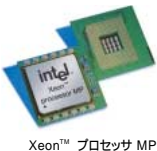
Xeon™ プロセッサ MP

最新Xeon™プロセッサ MPを搭載 CPUにIntel社のXeon™プロセッサ MP 1.6GHz/1.5GHzを搭載。革新的なNetBurst™マイクロアーキテクチャにより、処理の高速化を実現します。さらに、物理的に1つのプロセッサを論理的な2つのプロセッサとして動作させることが可能なハイパースレディング™テクノロジーを採用。マルチスレッド処理を行うアプリケーション(データベースなど)での性能向上に大きな効果があります。4CPUまでのSMPに対応し、ハイパフォーマンスなシステムをご提供します。