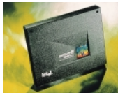
Pentium® III Xeon™プロセッサ

最新CPU Pentium® III Xeon™プロセッサ700MHzを搭載 CPUには、Pentium® III Xeon™プロセッサ700MHz(二次キャッシュ2MB/1MB)を標準で2個搭載。8WAY SMP構成を実現する「Profusion™チップセット」を採用することによりハイパフォーマンスなシステムの構築が可能です。