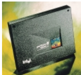
Pentium III Xeonプロセッサ

CPUには、0.18ミクロン・プロセス技術を採用し、CPUと同じ周波数で動作する二次キャッシュを256KB内蔵した最新のPentium®III Xeon™プロセッサ1GHz/933MHzを搭載。2CPUまでのSMPに対応し、ハイパフォーマンスなシステムをご提供します。