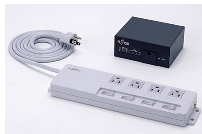
スマートコンセント

今後も富士通グループは、家庭や学校で児童一人ひとりが実践できる環境行動を具体的に考え、環境教育活動に取り組んでまいります。