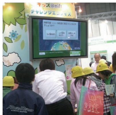
子ども達で賑わう「チャレンジエコクイズ」コーナー

「チャレンジエコクイズ」コーナーでは、子ども達の楽しそうな声が響きわたり、賑やかな雰囲気にも包まれました。好奇心を刺激するゲームや身近なクイズを通じて環境問題へのより深い理解を促し、環境行動への一歩を踏み出していただくきっかけになればと思っています。