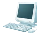
エラーチェックソフト (厚生労働省配布)