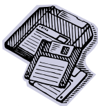
様式1ファイル (タブ区切りテキスト)