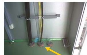
② ケーブル敷設・通線