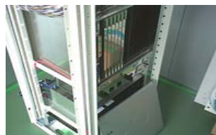
④ 通信機器架台据付