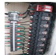
(簡易局舎内分電板)