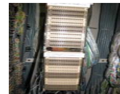
③ NTT MDF接続