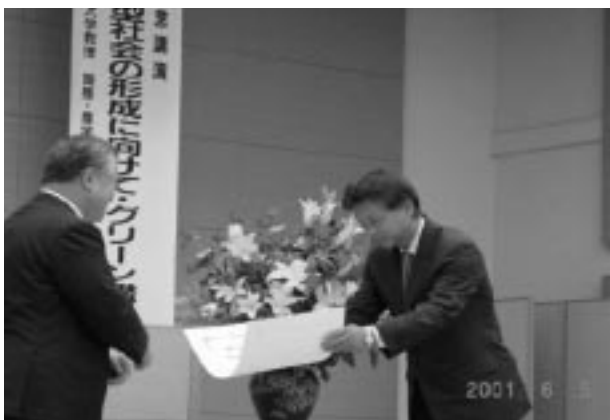
茨城県知事（左）より表彰状授与

今回の表彰は、ISO14001を取得し、エネルギー・廃棄物・用紙等の削減に、積極的に取り組んでいることが評価されたものです。