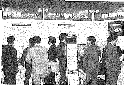
'97セキュリティショー