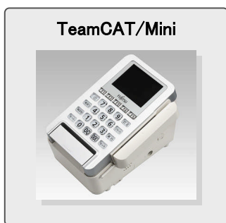
(2007年グッドデザイン賞受賞)