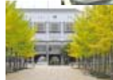
総合スポーツセンター

2,300社を超える導入実績を誇る「WebSERVE」と、 アウトソーシング運用に定評のある「AplSERVE」。