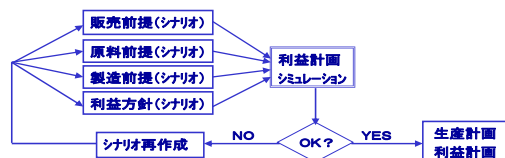
図3 利益計画シミュレーションの作業プロセス

実務では多様な計画やスケジューリングが頻繁に行なわれている。本来は作業に際し、相互依存関係が強い関連部署からシナリオを持つことによって共同作業を行う必要がある。